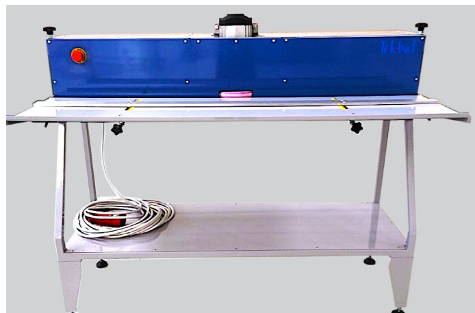
AFFILA RACLE VISTA FRONTALE SQUEEGEE'S SHARPENER FRONT VIEW