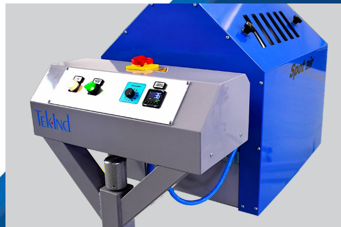
SPOT AIR (VISTA FRONTALE) SPOT AIR (FRONT VIEW)

Unità per l'asciugamento intermedio ad aria calda da collocarsi su macchine da stampa circolari automatiche o manuali. Disponibile in vari modelli da 6, 8, 9 e 13 kW. Disponibile nella versione carrellata per un facile posizionamento nei vari spazi di interasciugamento.