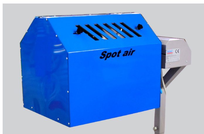
SPOT AIR (VISTA LATERALE) SPOT AIR (SIDE VIEW)