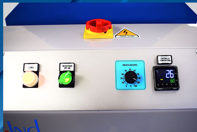
PANNELLO CONTROLLI SPOT AIR CONTROL PANEL