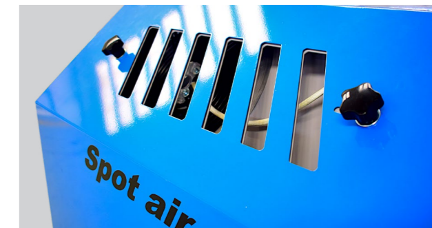
REGOLAZIONE FLUSSO ARIA IN INGRESSO INLET AIR REGULATION