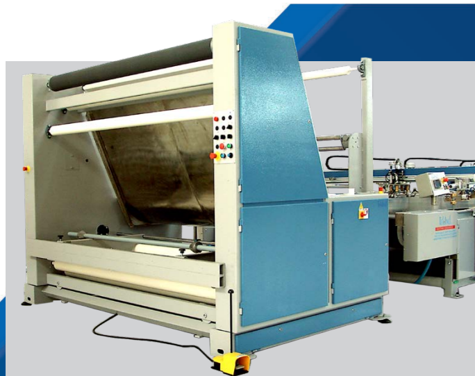
INTRODUZIONE PER BOBINE DI TESSUTO GESTITO DA FOTOCELLULA (VISTA RETRO) INTRODUCTION FOR FABRIC REELS MANAGED BY PHOTOCCELL (REAR VIEW)