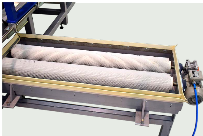
SISTEMA DI LAVAGGIO TAPPETO STAMPA ESTRAIBILE BELT WASHING SYSTEM, LATERALLY REMOVABLE