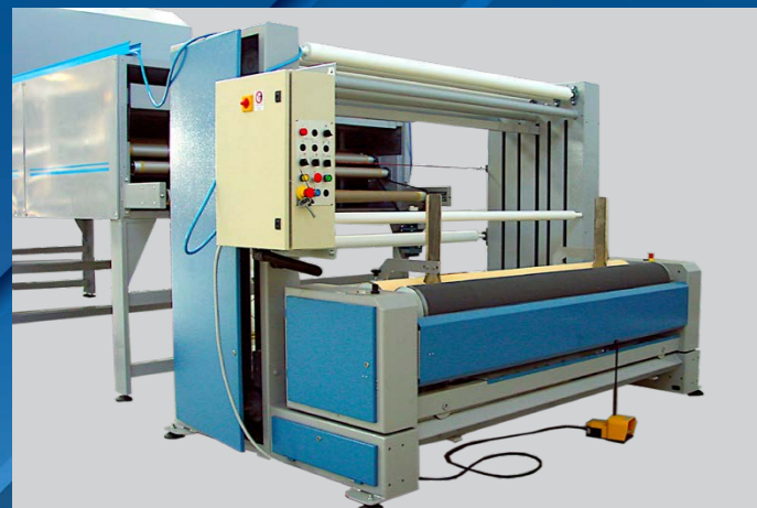
EXT-01 TX - RIBOBINATORE PER TESSUTI EXT-01 TX - REWINDER FOR FABRICS

Linea di stampa serigrafica a quadro per tessuti in continuo, con numero di unità di stampa personalizzabili in funzione delle richieste del cliente, la linea da stampa è così costituita: