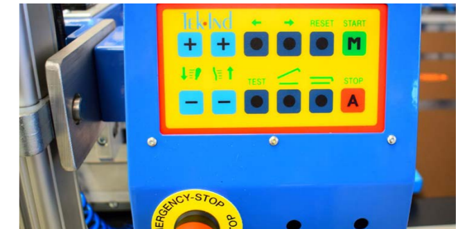
CONTROLLI SU UNITÀ DI STAMPA SERIGRAFICA SCREEN PRINTING UNIT CONTROL