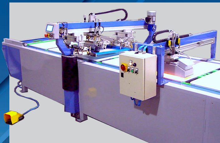
UNITÀ DI STAMPA E ASCIUGATURA IN LINEA PRINTING UNIT AND DRYING UNIT IN LINE