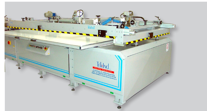
PIANO ESTRAIBILE FRONTALMENTE MOVABLE PRINTING PALLET, THAT CAN BE UNLOAD FROM THE FRONT