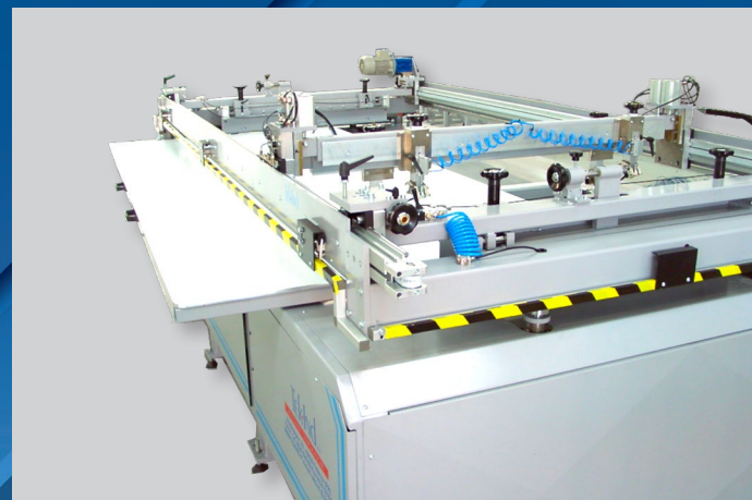
PIANO ESTRAIBILE FRONTALMENTE MOVABLE PRINTING PALLET, THAT CAN BE UNLOAD FROM THE FRONT

Omega-L è una macchina serigrafica piana appositamente studiata per soddisfare le esigenze dei clienti che richiedono di stampare in serigrafia grandi formati fuori standard. Il formato stampa è personalizzabile, come la gestione del carico/scarico dei pezzi che può variare in funzione dei materiali e dei supporti che è necessario gestire. Il piano stampa estraibile frontalmente.