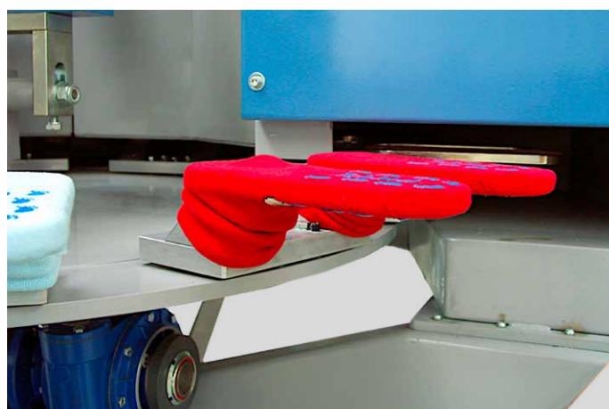
SAGOME PER STAMPA CALZE SOCKS PALLET