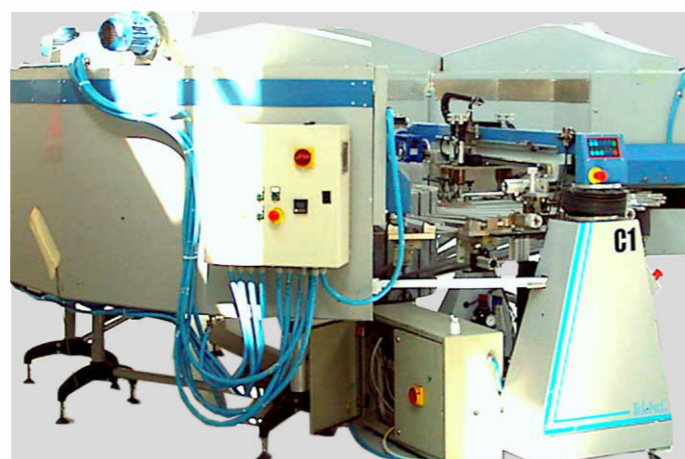
ALFA SOCKS 1-24 CON FORNO INTEGRATO ALFA SOCKS 1-24 WITH INTEGRATED DRYER