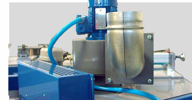
VENTOLA ASPIRAZIONE FUMI SMOKE SUCTION FAN