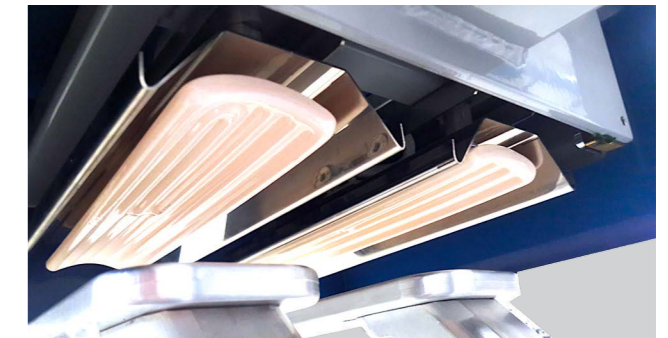
CAPPA A PANNELLI RADIANTI (VISTA DA SOTTO) DRYING HOOD (SEEN FROM BELOW)