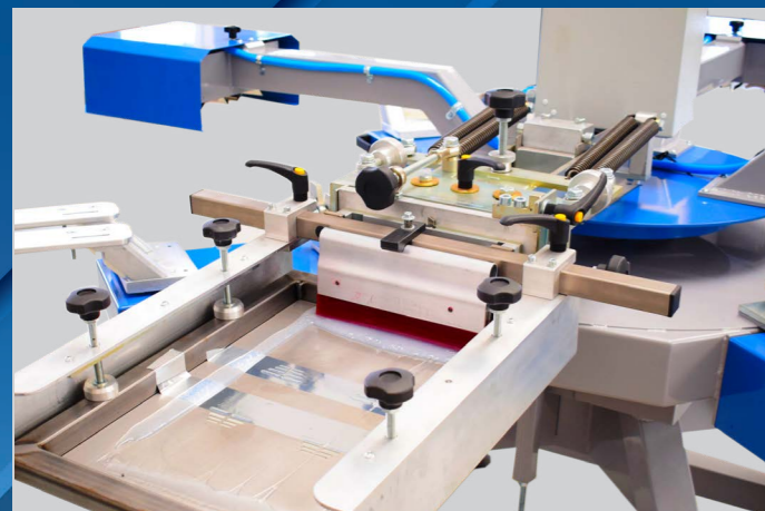
UNITÀ DI STAMPA PRINTING UNIT