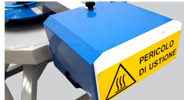
CAPPA A PANNELLI RADIANTI DRYING HOOD