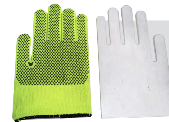
PIANI STAMPA PER GUANTI PRINTING PLATES FOR GLOVES

Disponibili anche piani a forma di guanti, di differenti forme e taglie.