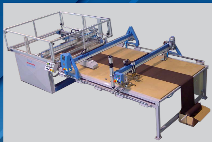
LC-1 X (VISTA DALL'ALTO) LC-1 X (UP SIDE VIEW)