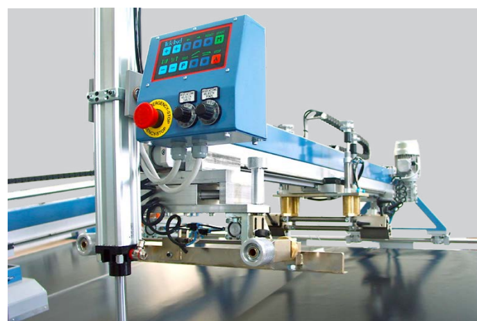
UNITÀ DI STAMPA SERIGRAFICA SCREEN PRINTING UNIT