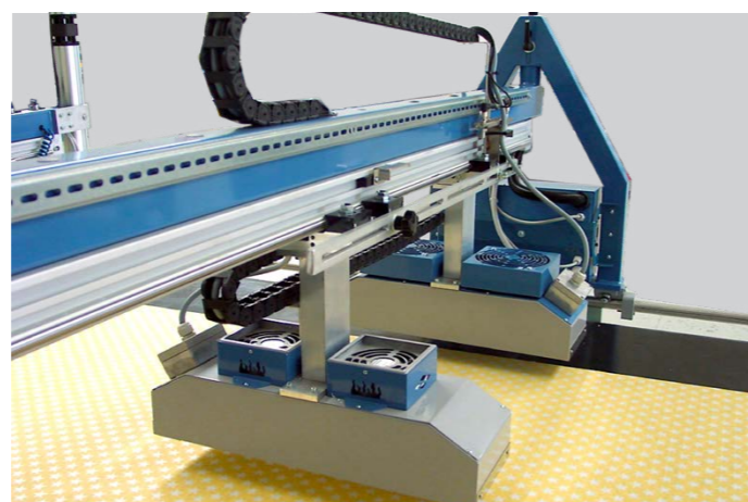
CAPPA DI ASCIUGAMENTO IR40 X 2 IR40 X 2 DRYING HOOD