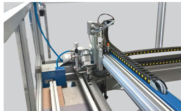
TAGLIERINA TRASVERSALE CROSS CUTTER